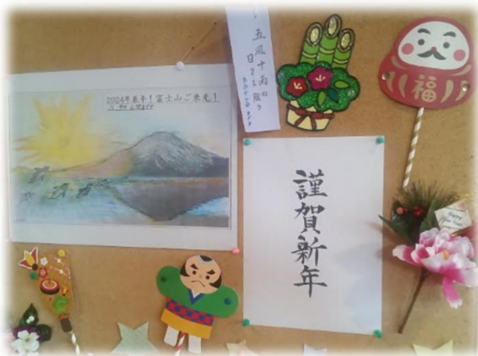
「あおぞら福祉のご来光」 今年も見事なご来光でした。